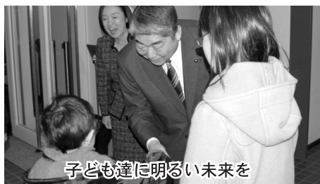
子ども達に明るい未来を