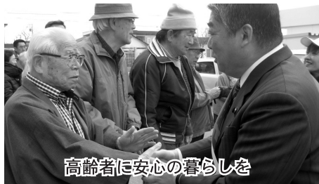
高齢者に安心の暮らしを