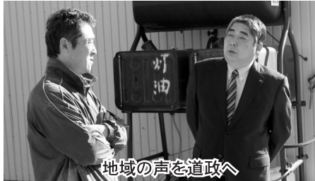
地域の声を道政へ