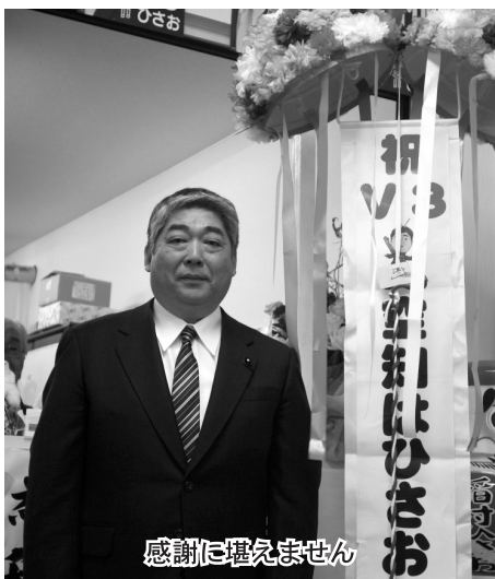
感謝に堪えません