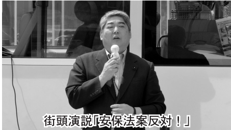
街頭演説「安保法案反対！」