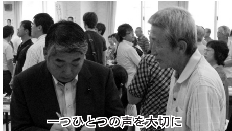
一つひとつの声を大切に