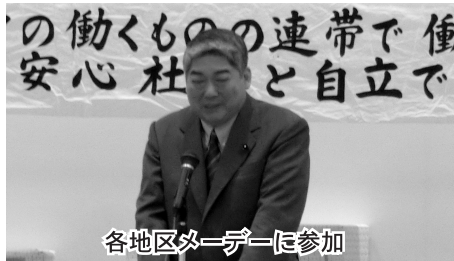
各地区ミーティングに参加