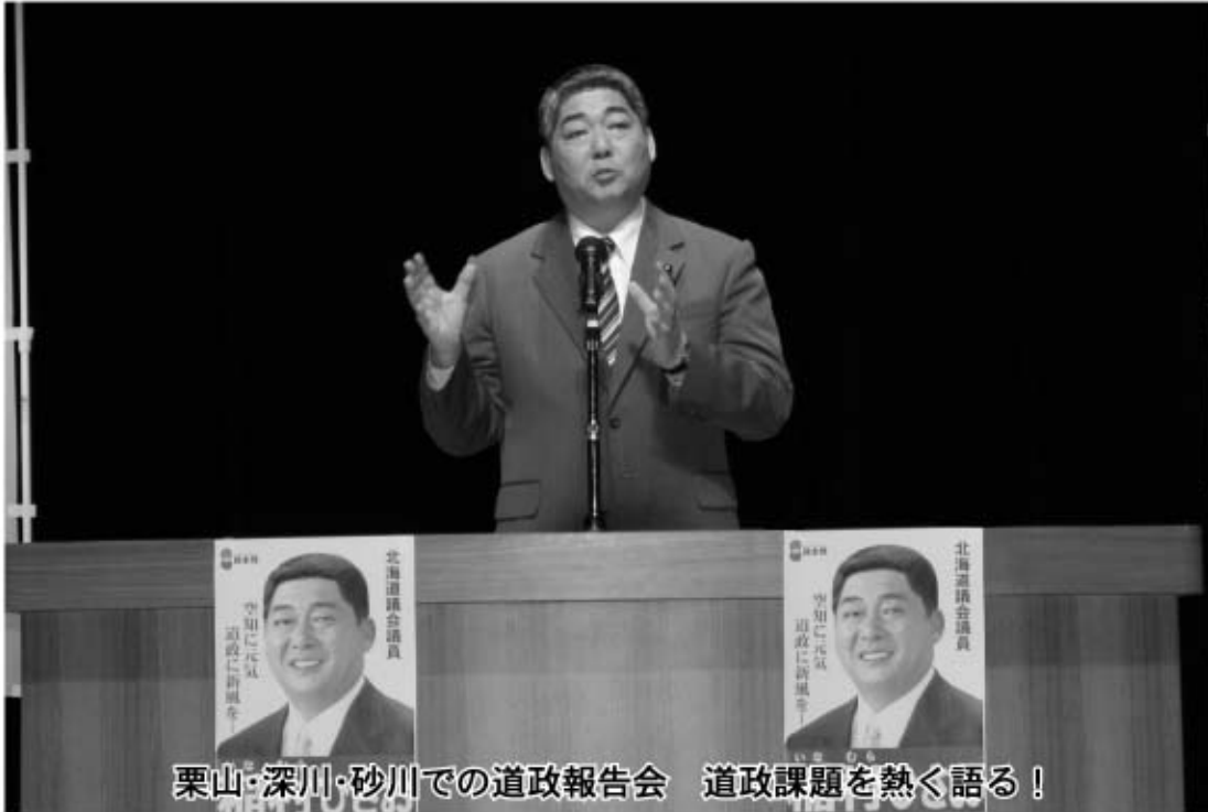
栗山・深川・砂川での道政報告会 道政課題を熱く語る!