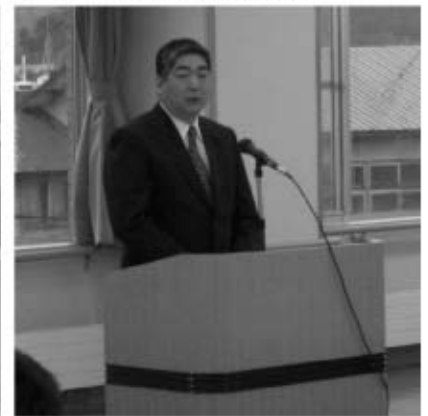
芦別後援会設立でお礼の挨拶