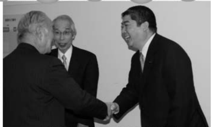
「新春の集い」で支援者から激励を受ける