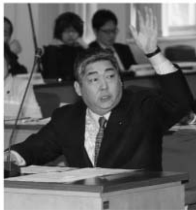
地域医療について質問