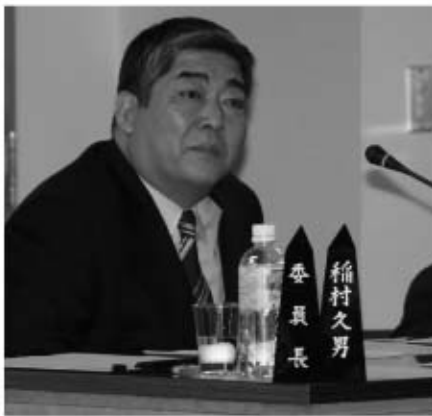
委員長席で議事を進行