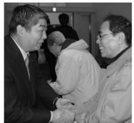
支援者へ日ごろのお礼