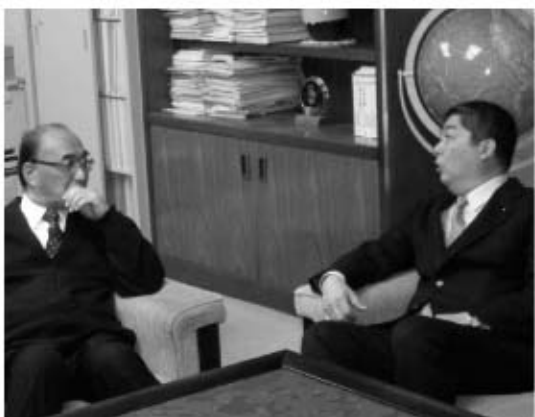
空知管内の首長と意見交換