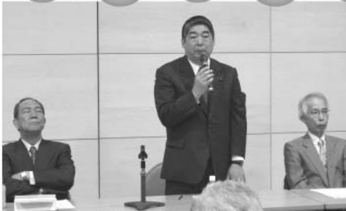
連合後援会総会でお礼の挨拶