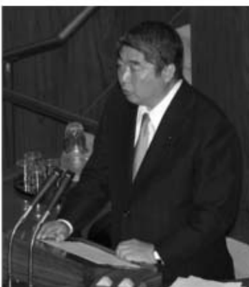
口蹄疫対策の質疑