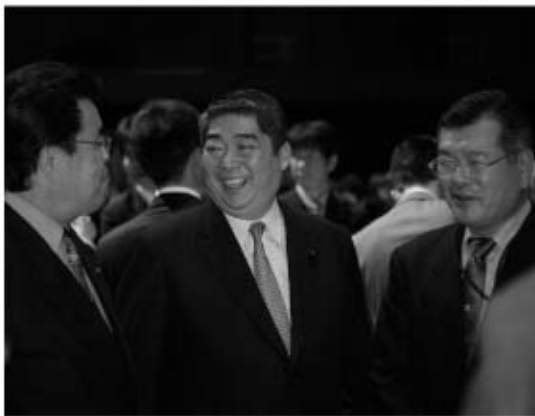
支援者との会話に笑みがこぼれる