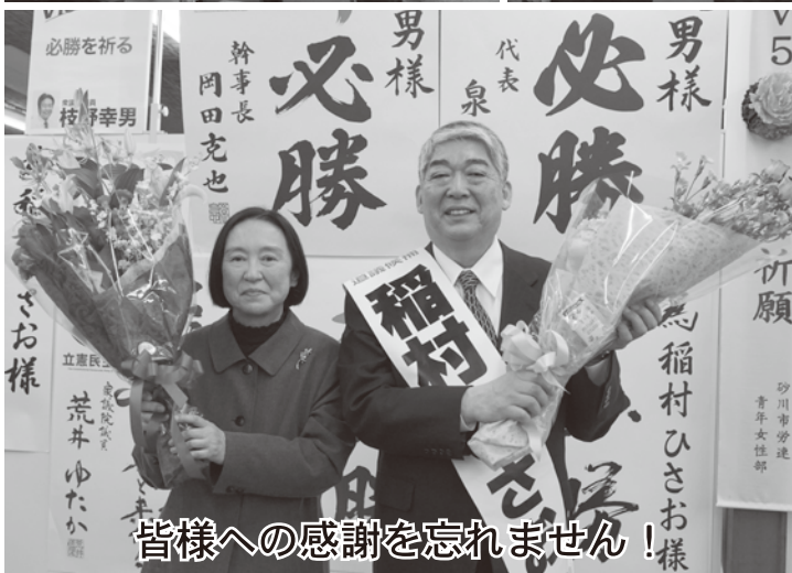
皆様への感謝を忘れません！