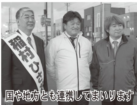
国や地方とも連携してまいります