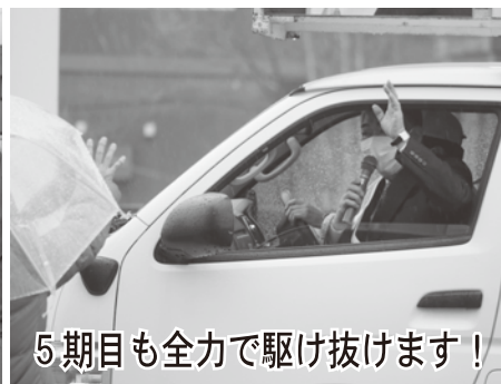
5期目も全力で駆け抜けます！