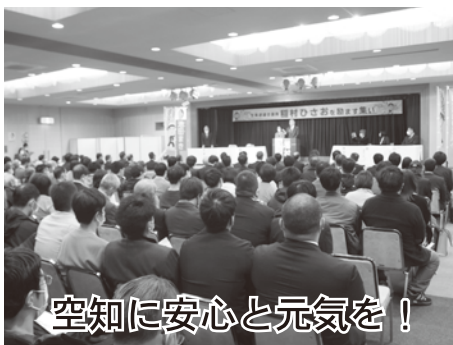
空知に安心と元気を！