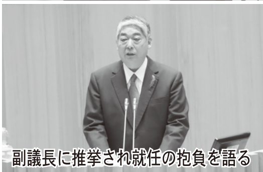
副議長に推挙され就任の抱負を語る