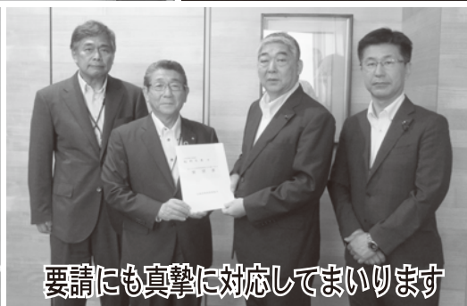
要請にも真摯に対応してまいります